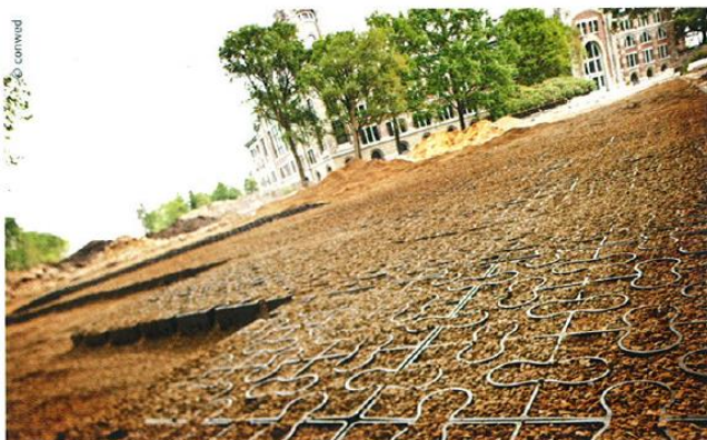
Ici avec un remplissage en graviers minéraux classiques