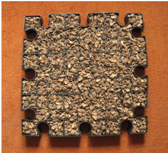
Remplissage des alvéoles avec du Biogranulats

Netpave 25 & 50 de Conwed représente un profil en polyéthylène haute densité recyclé, destiné à protéger les surfaces en gazon, en terre ou en gravier, de l'érosion et du déplacement des concassés, y compris sur un sol en pente. Réponse aux problèmes de drainage des eaux pluviales ou de ruissellement, il est destiné aux chemins, parkings, sentiers de promenade, pistes cyclables. Il autorise un poids de charge jusqu'à 300 tonnes au mètre carré. Netpave 25 est utilisé sur les surfaces de gazon existantes pour les protéger, sans encaissement ni fondations. Il améliore la traction des véhicules. Le profil devient presque invisible après une période de deux à trois mois mais peut être posé également de façon temporaire. Netpave 50 nécessite une préparation du terrain ; sa conception garantit une accessibilité en fauteuil roulant.